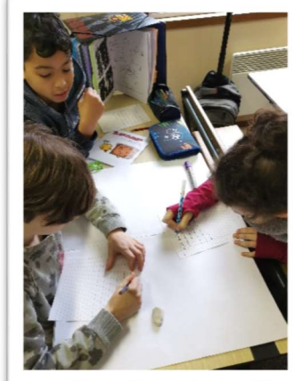
Travail collaboratif – P4