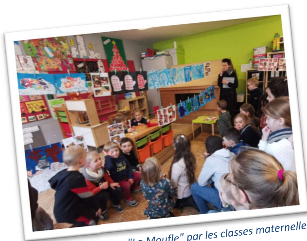
Expo "La Moufle" par les classes maternelles