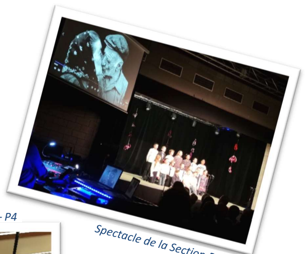
Spectacle de la Section Primaire